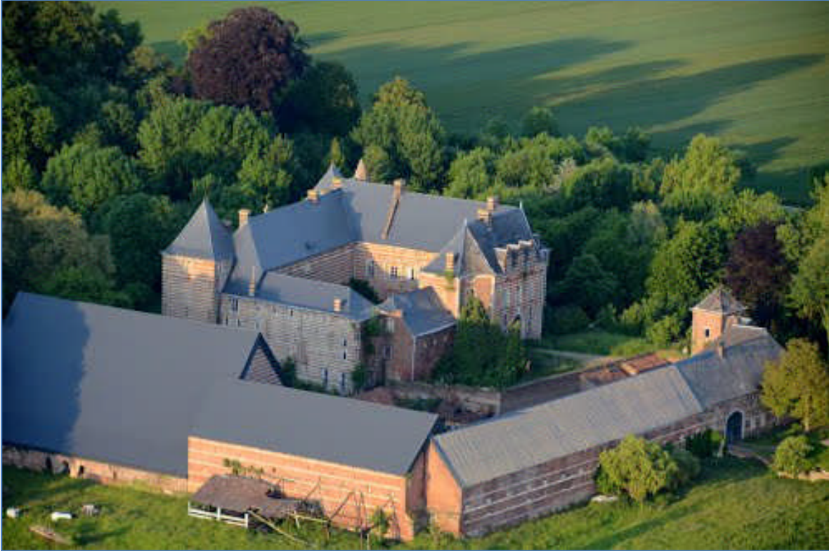
Kasteel van Heers