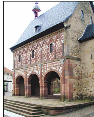
Abdij van Lorsch - koningshal

“In het jaar 764 na de vleeswording van de Heer regeerde Pippijn, de koning van de Franken, in het 12 e jaar”. ( hierna volgt een uiteenzetting hoe Pippijn ( III de Korte 714-768) 12 jaar daarvoor aan de macht was gekomen)