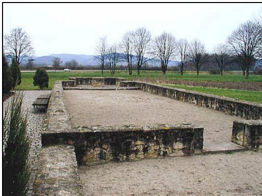
Altenmünster/Lorsch klooster 764