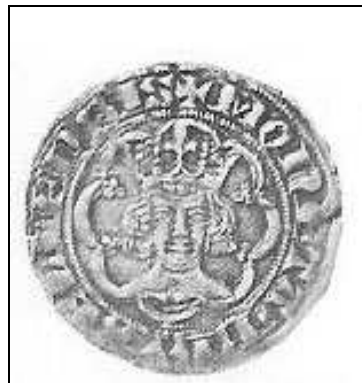
Hertog Jan III ( 1312-1355) Afbeelding op een halve groot een munt uit 1338