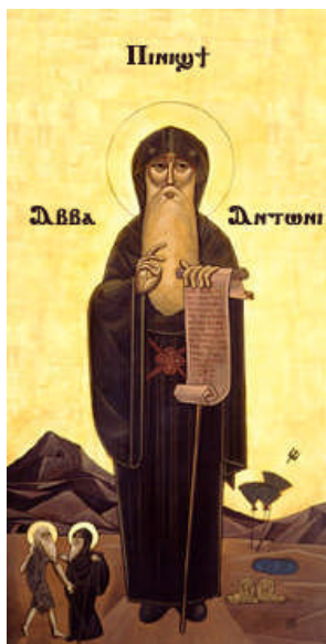
Sint Anthonius 251-356

Anthonius werd geboren in 251 als kind van rijke ouders. Toen hij twintig jaar was, stierven zijn ouders. Hij gaf al zijn bezittingen aan de armen en trok zich in eenzaamheid in de woestijn terug. Later voegden andere christenen zich bij hem en vormden een van de eerste gemeenschappen van monniken in zijn klooster van Sint Anthonius in de Oostelijke Woestijn van Egypte. Hij was de eerste monnik die vele volgelingen kreeg en staat daarom bekend als de vader van het kloosterleven. Hij stierf op 105-jarige leeftijd in 356. Sint Anthonius werd in onze streken aangeropen als pestheilige.