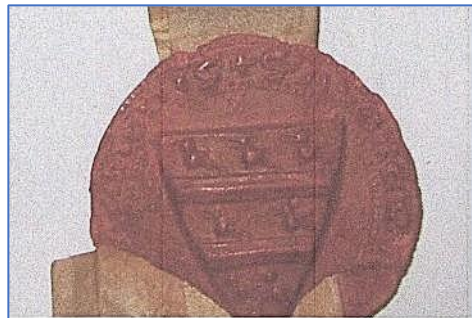
Zegel Albert III van Herpen 6 januari 1303