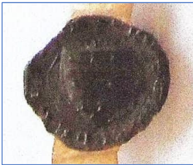
Zegel Rutger II van Herpen 5 januari 1301

Rutger II, heer van Herpen wordt genoemd in een oorkonde van 5 januari 1301 en Albert III, ridder, heer van Herpen zijn broer, in een oorkonde van 6 januari 1303. Aan beide oorkonden hangen hun zegels in rode was. 18